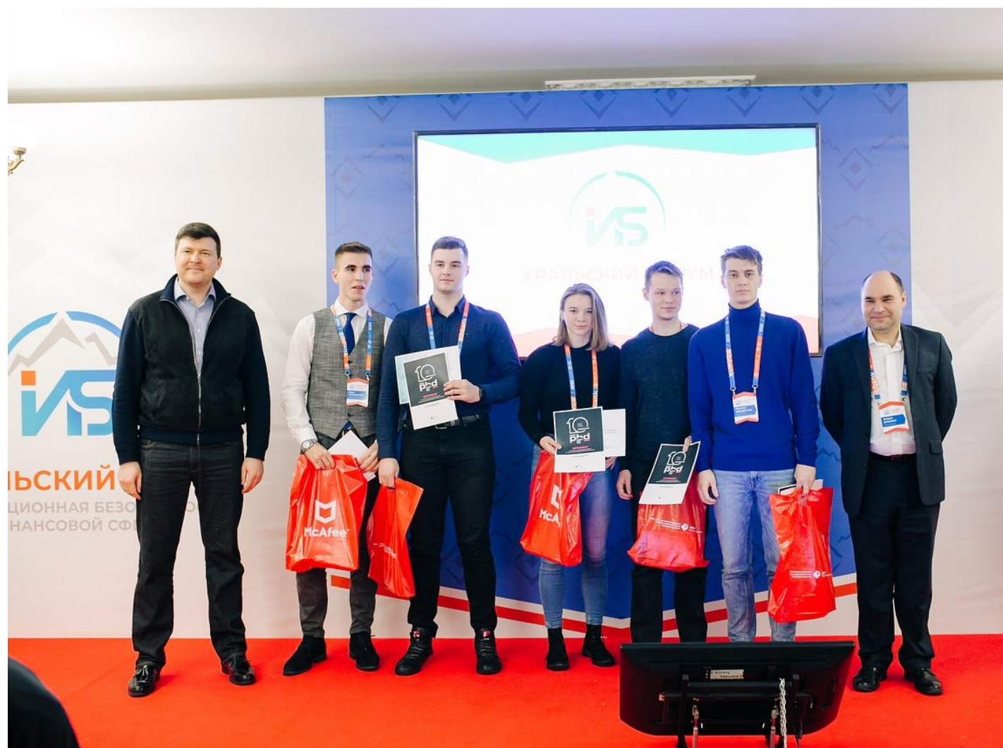
Команда ДВФУ одержала победу на Уральском форуме по информационной безопасности финансовой сферы, проводимом Банком России в г. Магнитогорск